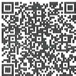
QR Code ๑ ยืนยันการเข้าร่วมประชุม