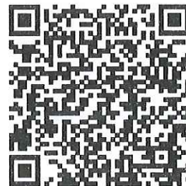
QR Code ๒ ตรวจสอบจำนวนผู้ชำระค่าลงทะเบียนแต่ละรุ่น